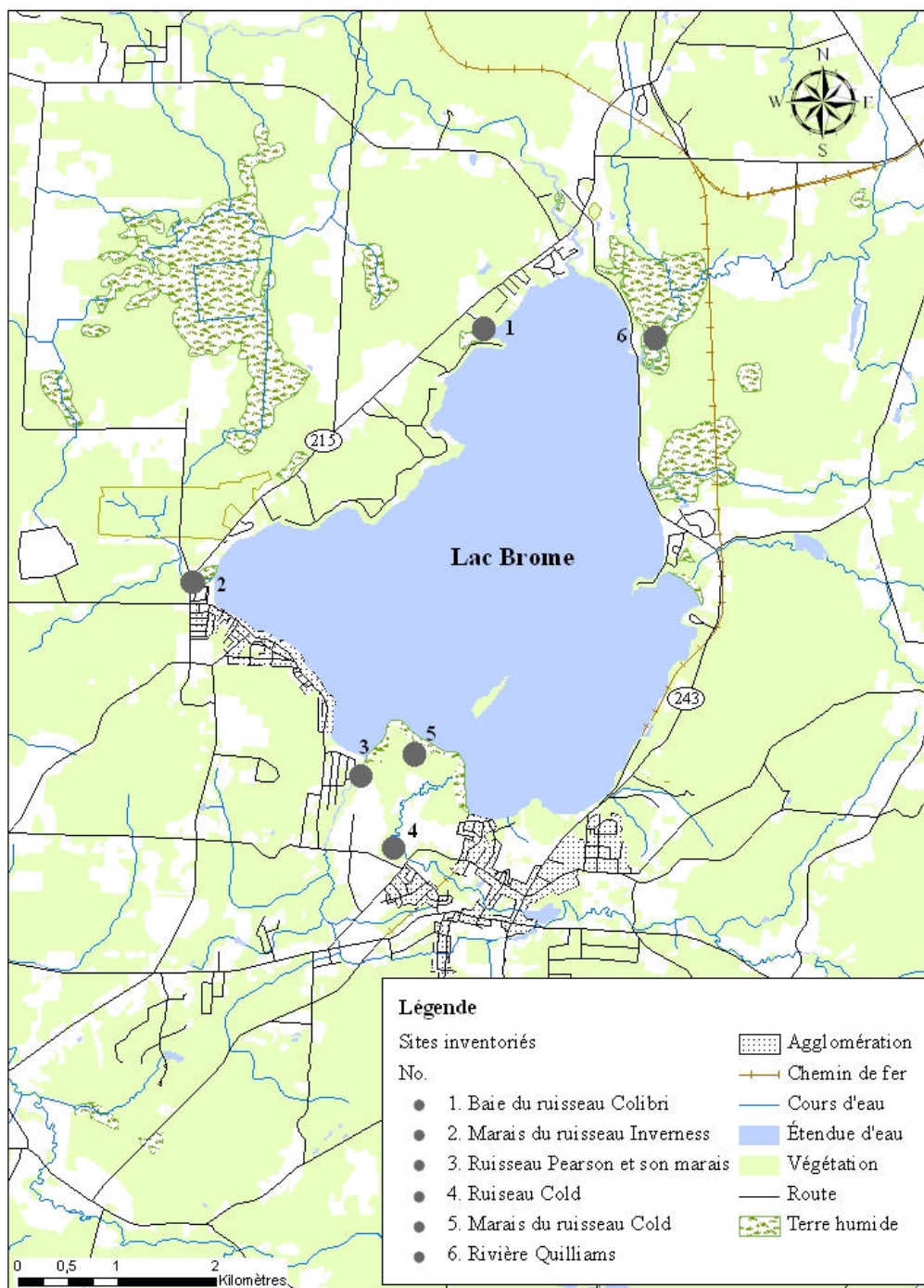
Figure 1. Localisation des secteurs inventoriés pour les poissons au lac Brome en juin 2011