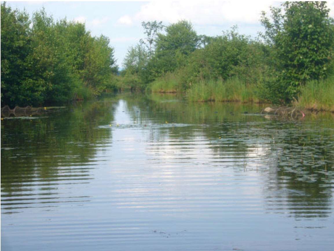
Figure 3. Vue d'une partie du marais du ruisseau Inverness, d'amont en aval (remarquez les verveux placés de part et d'autre du marais).

Ce marais se trouve à l'embouchure du ruisseau Inverness. Il est situé juste en aval du ponceau de la route 215 et s'étend sur 200 m de long environ avant d'atteindre le lac Brome. Ce marais a été fortement remblayé par le passé, il n'en subsiste maintenant qu'un corridor d'environ 20 à 40 m de largeur. Le rivage est formé de graminées et d'aulnes. Les plantes aquatiques sont majoritairement représentées par les nénuphars, les potamots, les rubaniers, et l'élodée. En termes de physico-chimie, les paramètres observés montrent des valeurs moyennes.