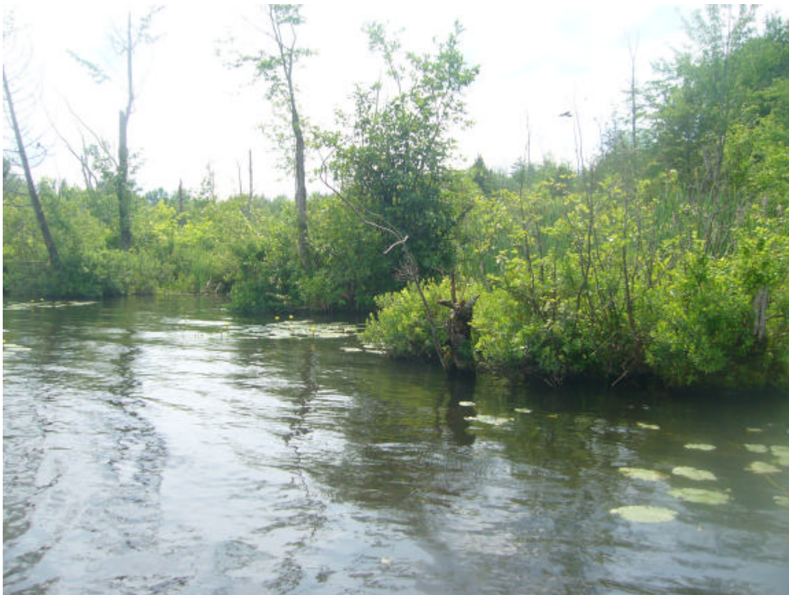
Figure 2. Baie du ruisseau Colibri, secteur de l'embouchure du ruisseau.

Ce petit marais se trouve à l'embouchure du ruisseau Colibri, dans la baie adjacente au lac Brome. Dans ce secteur, les rives sont bordées par du Myrique baumier et la végétation aquatique est constituée entre autres de quenouilles, d'élodées et de Grand nénuphar jaune. La température de l'eau y est relativement élevée, soit de 24,4°C lors de notre visite le 28 juin, ce qui constitue la température la plus élevée enregistrée pendant les 4 jours d'inventaires des différents secteurs. Fait intéressant à noter, la conductivité est aussi la plus faible enregistrée (0,155ms/cm) dans les sites visités en 2011. Les eaux sont relativement neutres (pH = 7,14) et l'oxygénation est bonne (9,11 mg O 2 /L), ce qui est semblable à ce qui a été observé ailleurs.