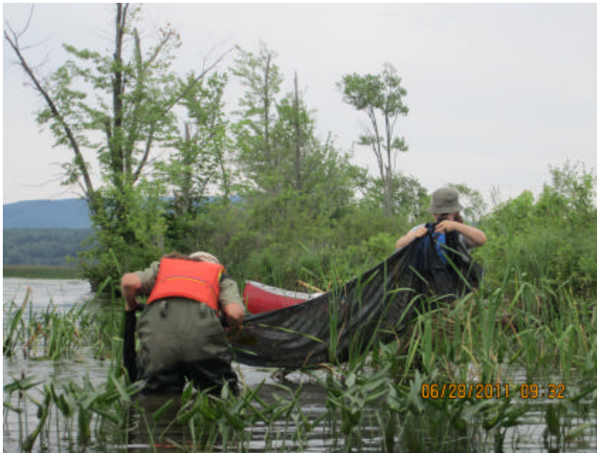
Figure 8. Relevé à la petite seine.

La seine utilisée mesure 5 m de longueur et 1 m de hauteur, avec des mailles de 2,5 mm. Elle est faite de tissu noir et munie dans le haut de flotteurs et au bas d'une corde plombée. On l'utilise à deux personnes, chacune tenant une extrémité de façon à échantillonner dans la colonne d'eau. Cette technique favorise la capture de petits poissons et peut se faire dans des habitats marécageux. En effet, comme la végétation aquatique non fixée (ex : algues) et les débris (ex : branches) sont récoltés en même temps que les poissons, l'utilisation d'une seine de plus grande dimension n'aurait pu être possible dans les habitats visités. Un coup de seine se fait sur une distance de 2 à 10 m du rivage, selon l'habitat, et les deux personnes avancent en même temps en tenant chacun une extrémité, en s'assurant que le bas de la seine touche au fond et que le haut flotte, sinon les poissons peuvent fuir. La seine est ainsi apportée du large vers la rive, parfois relevée avant si le poids des végétaux recueillis est trop important et elle est ensuite étendue sur le sol pour y trier son contenu.