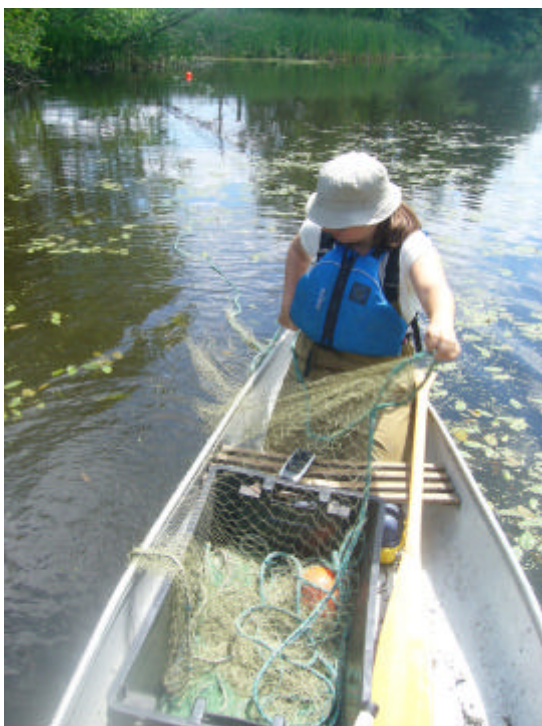
Figure 10. Pose d'un filet maillant à partir d'un canot.