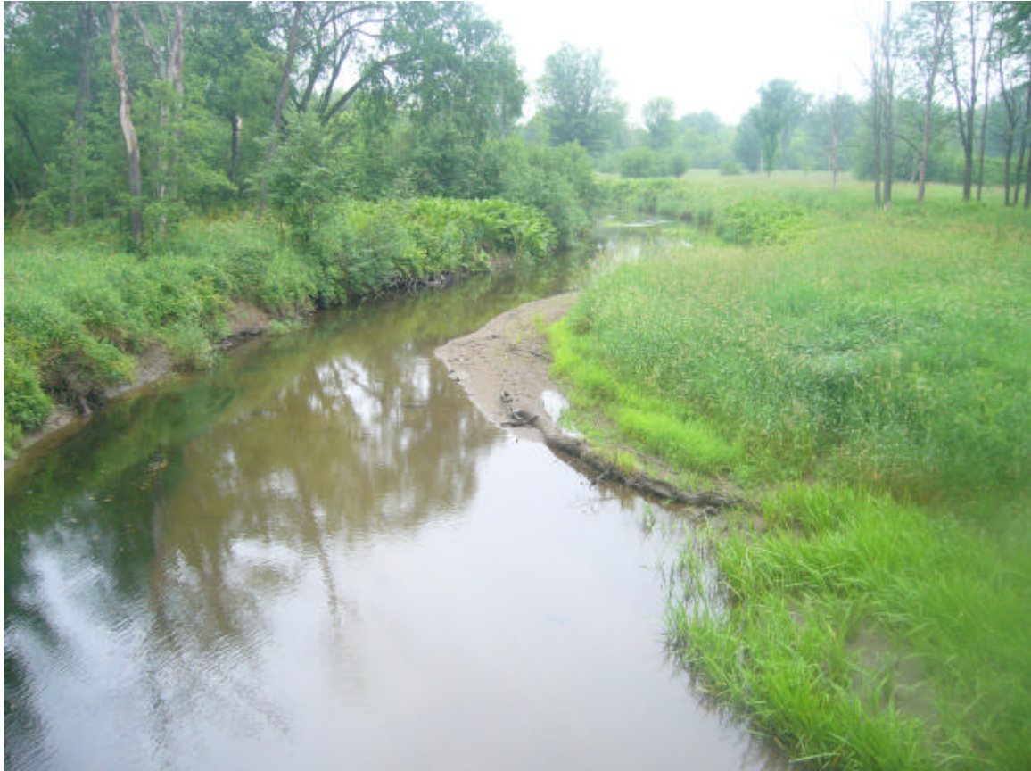
Figure 5. Vue d'un secteur du ruisseau Cold, d'amont en aval.

Le ruisseau Cold a été inventorié du chemin Victoria en aval sur environ 200 m. Ce cours d'eau présente un courant moyen avec fond de sable, un peu de cailloux et de branches. On y retrouve très peu de végétation aquatique. La température de l'eau est sans surprise relativement froide et l'eau bien oxygénée (9,95 mg O 2 /L).