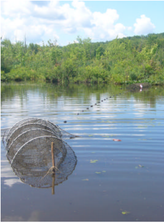
Figure 9. Deux verveux rattachés par un guideau.