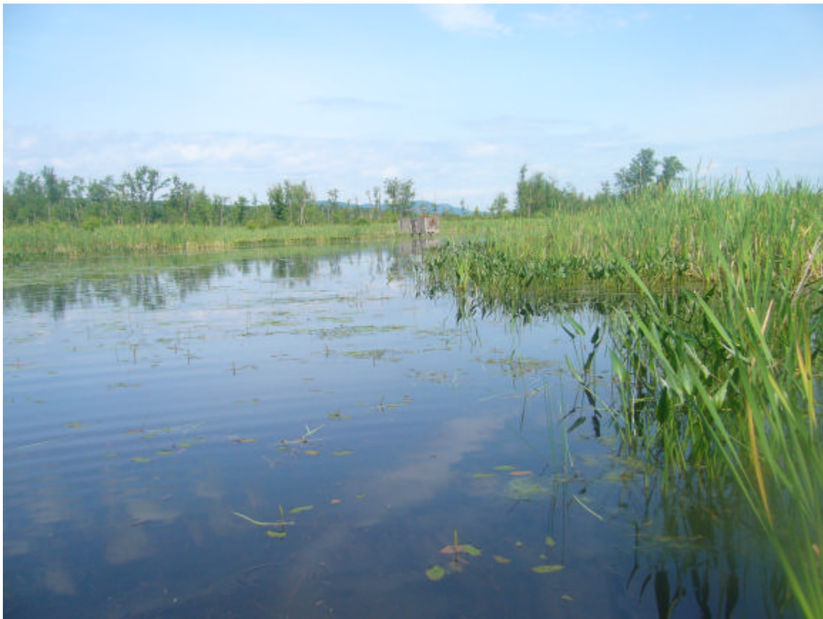
Figure 4. Vue d'un secteur du ruisseau Pearson.

Le ruisseau Pearson est une rivière lente bordée de marais. À son embouchure se trouve un marais plus large, avec baies riches en végétation. Le site a été visité sur toute sa longueur, du chemin Centre jusqu'à la baie Elizabeth-Ann-Beach, de même que le marais situé dans une branche juste à l'est du chenal principal du ruisseau à l'embouchure. Les rives sont bordées d'arbustes divers et de quenouilles. La végétation aquatique est quant à elle diverse et variable selon les secteurs, mais on remarque la présence de Lentilles d'eau, d'élodées, de myriophylles, de potamots et à quelques endroits des nénuphars, de Brasénies de Schreber et des sagittaires. Les caractéristiques physico-chimiques varient également selon les secteurs, mais sont moyennes dans l'ensemble. L'oxygénation est plus élevée et la température plus élevée dans le marais situé à l'est de la baie que dans le chenal principal du ruisseau Pearson.