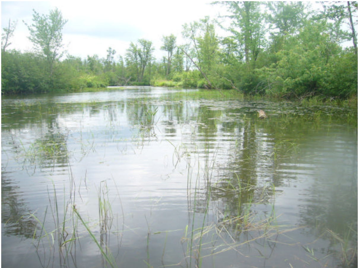
Figure 7. Vue d'un secteur de la rivière Quilliams.

Le secteur étudié s'étend de l'embouchure au lac Brome (chemin Lakeside) jusqu'à 1,4 km en amont. Il se termine juste à la jonction avec le ruisseau Durrull. La température est moyenne dans l'ensemble (21,5 à 23°C), ainsi que la conductivité (0,231 à 0,267 ms/cm), sauf à la station située à la jonction avec la ruisseau Durrull où des valeurs très élevées sont observées (0,413 ms/cm). Quant à l'oxygénation et au pH, des valeurs plus faibles sont observées dans les deux baies isolées de l'embouchure comparativement aux stations situées dans le chenal. Dans la baie située derrière l'auberge, l'oxygénation est très faible (2,67 mg O 2 /L). Comparativement aux ruisseaux Pearson et Cold, la végétation aquatique y est très diverse, mais on y retrouve aussi une plus grande abondance d'algues, forte par endroits.