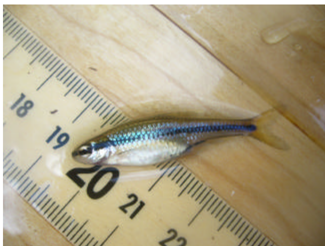
Figure 13. Méné d’herbe.

Le Méné d’herbe, très rare dans la région, y est seulement connu des lacs Memphrémagog et Magog plus à l’est (Desroches et coll. 2008). Le lac Brome représente le troisième plan d’eau d’où l’espèce est connue dans la région, lesquels sont isolés de l’aire principale dans le fleuve Saint-Laurent, ce qui représente un intérêt pour la conservation. Ce méné a été identifié dans trois sites soit le ruisseau Pearson, le marais du ruisseau Cold et la rivière Quilliams. Le ruisseau Pearson et son marais semblent abriter une importante population. Quant au Brochet maillé, commun dans la région mais peu répandu au Québec, il a été trouvé dans cinq des six sites inventoriés. Il semble très commun dans les habitats du lac Brome, particulièrement à la rivière Quilliams où il fut l’espèce dominante.