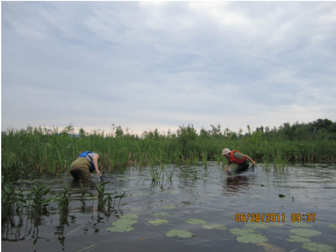
Figure 6. Relevé à la petite seine dans un secteur du marais du ruisseau Cold.

Ce marais présente un fond organique et de limon avec une végétation abondante, il est similaire au ruisseau Pearson dans l'ensemble, sauf son rivage à l'embouchure où la végétation est dominée par des scirpes, des prêles et de la Vallisnérie d'Amérique. Les données physico-chimiques sont semblables à celles observées dans le ruisseau Pearson, quoique la conductivité y est légèrement plus faible (0,0174 et 0,184 ms/cm), ainsi que le pH (6,78).